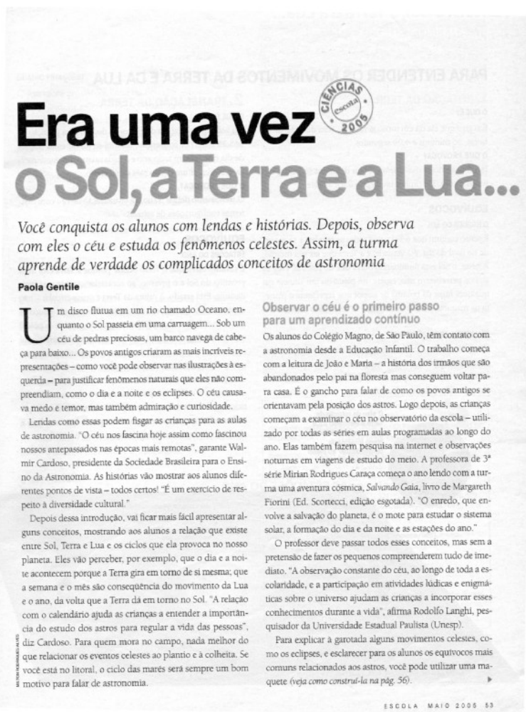
Figura 2. História (p. 53)

Dessa forma, o imaginário de prática educacional na Revista é aquele da "receita", algo linear, onde o resultado estaria garantido se o professor seguir todos os passos, que foram elaborados na estrutura da Revista. Na formulação aqui analisada, os verbos encontram-se no presente do modo indicativo: "conquista", "observa", "estuda", "aprende", o que indica uma certeza, uma garantia de que a aprendizagem ocorrerá. Seguindo os passos delineados, os alunos aprenderiam aquilo que se deve aprender na escola: o conhecimento verdadeiro, ou seja, o conhecimento científico. Referente a esse imaginário, vale citar Bourdieu (1998), quando diz que: